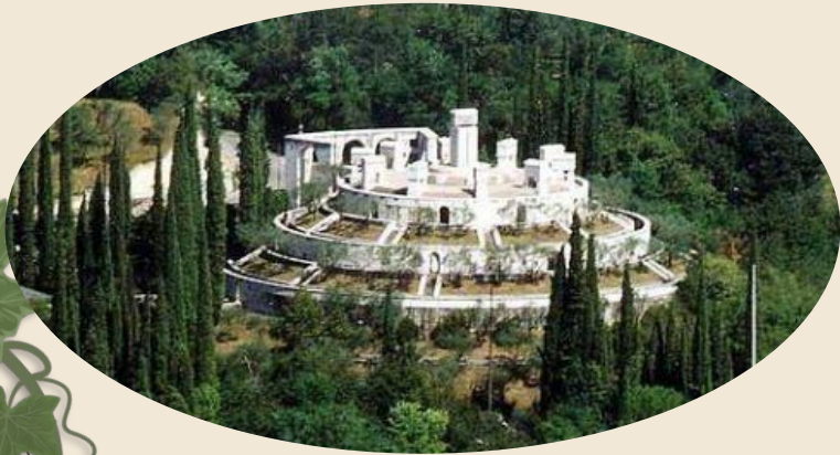
Mausoleo di D'Annunzio