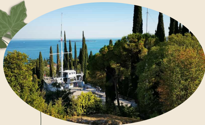
Regia Nave Puglia

Oltre all'anfiteatro, nel giardino del Vittoriale sono presenti molte altre meraviglie..