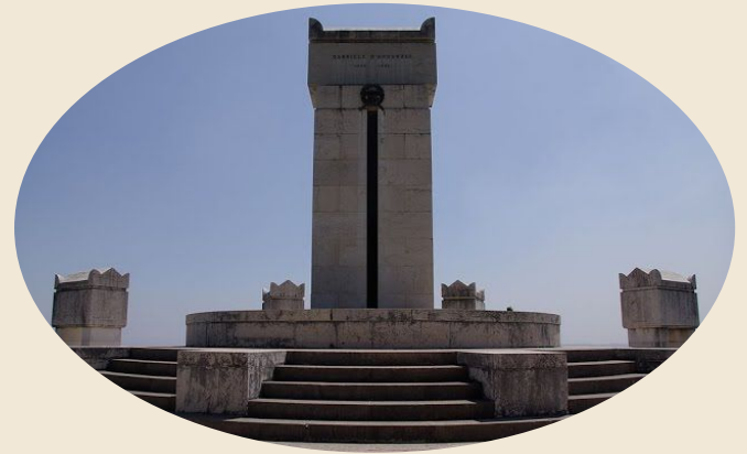
Tomba di D'Annunzio