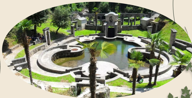
Laghetto delle Danze