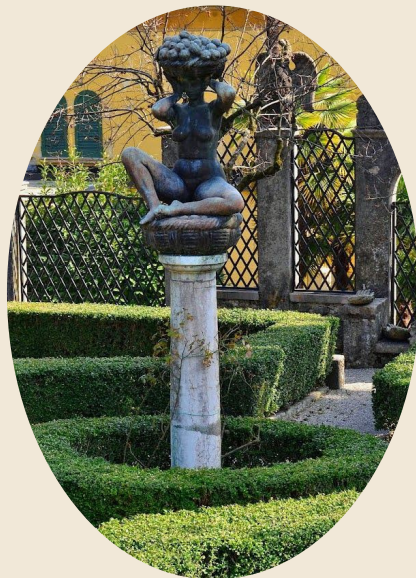
Canefora di Napoleone Martinuzzi